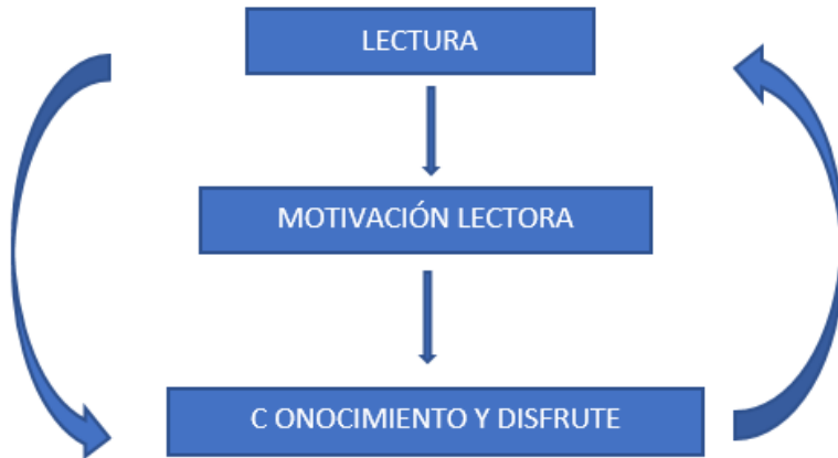
Figura 1. Significación de la lectura.

El esquema siguiente resume cómo evolucionaron los escolares a partir de la muestra y sus dificultades. En la actualidad, después de implementar las acciones antes descritas, solo el 13% de los escolares, continúa con algunas debilidades, pero con un mayor nivel de seguimiento por el maestro y la bibliotecaria.