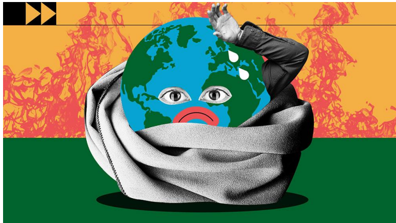
Imagen 1. Ilustración del cambio climático.

Las emisiones principales de gases de efecto invernadero que provocan el cambio climático son el dióxido de carbono y el metano. Estos proceden del uso de la gasolina para conducir un coche o del carbón para calentar un edificio, por ejemplo. El desmonte de tierras y bosques también puede liberar dióxido de carbono. La agricultura y las actividades relacionadas con el petróleo y el gas son fuentes importantes de emisiones de metano. La energía, la industria, el transporte, los edificios, la agricultura y el uso del suelo se encuentran entre los principales emisores. (Naciones Unidas, sf., párr. 1-3)