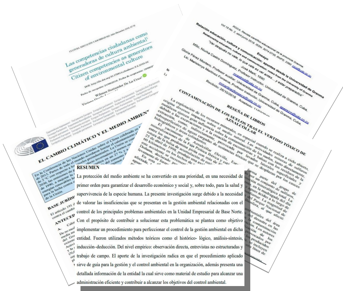
Imagen 3. Textos seleccionados para el desarrollo de la clase práctica propuesta como ejemplo.

A partir de estos cinco textos, cada equipo realizará un análisis, cuyo resultado será expuesto luego por un representante de forma oral. Se utiliza como medio una hoja de trabajo con la guía de actividades que deben resolver los estudiantes, para lo cual es esencial la preparación previa que realizaron como parte del estudio independiente (ver imagen 4).