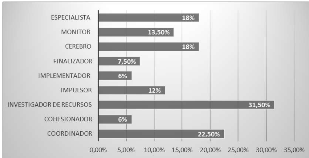
Gráfica 3. Rol adoptado por los alumnos en los equipos de trabajo.

Item 3. ¿Cuál considera cual fue tu rol en tu equipo de trabajo?