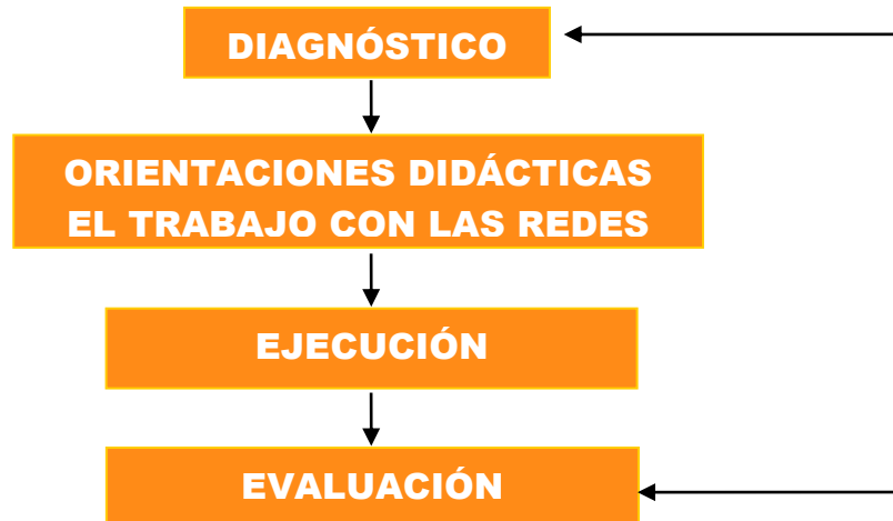
Figura 1. Esquema para la orientación didáctica del trabajo con las redes sociales.