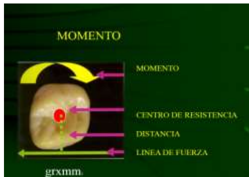
Imagen 2 Momento del diente

Existen varios criterios sobre estos conceptos. Respecto al centro de resistencia este se encuentra entre el 24 a 35% de la longitud de la raíz iniciando de la cresta alveolar y en un periodonto sano con dientes intactos, el centro de resistencia se localiza entre 2/3 y 1/3 de la distancia a partir de la cresta alveolar hasta el ápice radicular. La ubicación del Cr depende del tamaño, forma de los dientes, número de raíces y la calidad de tejidos de soporte (periodonto). El centro de rotación en figuras bidimensionales, puede definirse como un punto alrededor del cual un cuerpo parece haber girado, según se determina a partir de sus posiciones inicial y final. Y el momento se define, como una tendencia a la rotación de un diente. Para producir un movimiento diferente de inclinación por la aplicación de una fuerza en el bracket, una tendencia rotacional debe ser adicionada (Fídhel Ramírez, 2019).