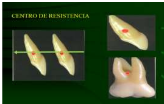
Imagen 1 Centro de resistencia del diente

Un diente en la cavidad bucal no es un cuerpo libre porque sus tejidos periodontales de soporte lo frenan. El centro de resistencia es equivalente para los cuerpos libres. Cualquier fuerza que actúe a través del centro de resistencia de un diente hace que la pieza se traslade en cuerpo.