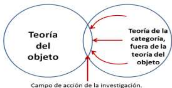
Ilustración 2 transposición de teoría a la teoría del objeto

acción; se buscan los rasgos o aspectos que no hayan sido estudiados en la teoría del objeto que se investigará y que se consideren relevantes, novedosos, pues permitieron resolver contradicciones semejantes en los objetos en que se estudió, por lo que se infiere que estos rasgos o aspectos pueden emplearse para contribuir a la teoría. La referencia a dichos documentos se empleará como evidencia de que puede resolverse la contradicción de la investigación y de que se puede incrementar la teoría del objeto.