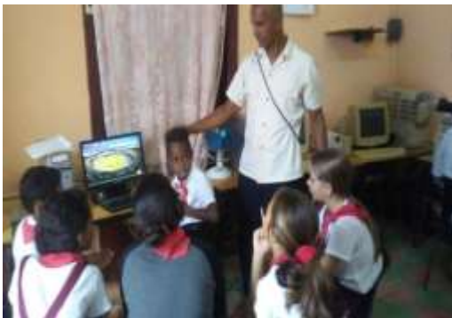
Figura 1. Niños de la escuela primaria Miguel de Cervantes en Baracoa

El 80% de los profesionales consideran la propuesta en el rango de 5 (totalmente de acuerdo), el 10% considera la propuesta en el rango de 4 (de acuerdo) y solamente el 10% lo consideró en el rango de 3 (ni de acuerdo ni en desacuerdo), por lo que consideramos que la multimedia para potenciar los conocimientos del béisbol en niños de la enseñanza primaria del municipio Baracoa es positiva para dar solución a las dificultades detectadas. La propuesta es evaluada de idónea para ser aplicada en las escuelas y la comunidad en general a fin de incrementar la práctica del béisbol en estas edades.